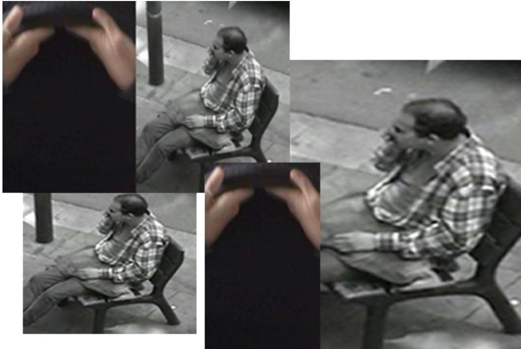
CAIDA LIBRE / Brisa MP Ejercicios Urbanos Barcelona, 2006

utilizam. Não são produções que abarcam grandes custos de produção, já que, mais que sua implicância formal, o sentido de investigação e experimentação é que são prioritários.