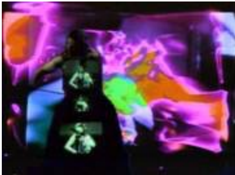
Nam June Paik /Global Groove

produções de videoarte e videoperformance, porque aqui não há restrições quanto à intervenção através de fotografias, textos ou o que seja possível para enriquecer o sentido do trabalho. Estas produções são realizadas por artistas que estabelecem propostas mais conceituais que formais e, em geral, são produções de baixo orçamento, autogestionadas, mesmo que se considere que existam outras com mais recursos, colaborativas e co-produzidas. A obra Global Groove , do recém falecido Nam June Paik, e as videoperformances de Vito Acconci podem servir como indicação e como referência de produções da década de 70.